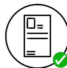
Del original, legible Completo

Nota: Se solicita estar al pendiente de la validación de documentos: