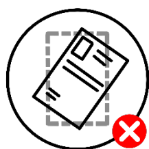
Sin cortes de margen alineado

Los documentos deben escanearse del original, en buen estado, legible, completos (todas las hojas), por anverso y reverso (según sea el caso), sin cortes de margen y se encuentre en el espacio correspondiente en la plataforma, de lo contrario se invalidará su registro al proceso de inscripción.