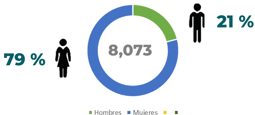
Gráfico 2. Matrícula por sexo