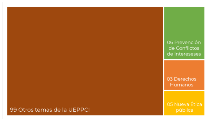
Grafica 1. Constancias 2021

Las constancias nos indican que la población se interesa sobre otra temática más allá de aprender sobre la nueva ética pública y los conflictos de intereses. Es importante hacer llegar a la comunidad los temas importantes sobre la nueva ética y sobre la prevención de los conflictos de intereses, pero esta gestión se caracterizará por iniciar con la comparativa estadística para saber a donde dirigir y potencializar las actividades que se plasmen en los programas de trabajo, mismos que son remitidos desde la Secretaría de la Función Pública pero con carácter potencializador por cada Unidad Responsable.